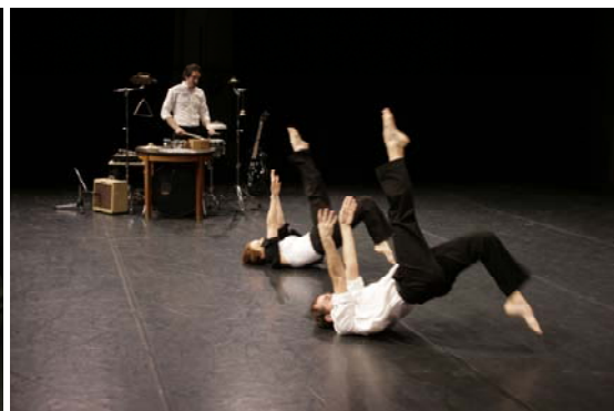
Barroco ©B. Gurlit