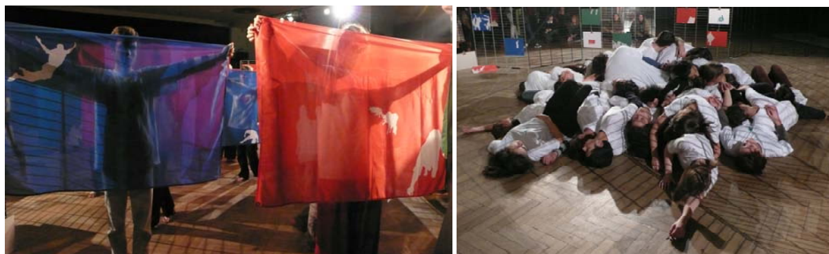
Les Journées impériales

9 et 10 mai 2007 en partenariat avec la malterie et la Quinzaine de l'entorse à la Maison folie de Wazemmes, Lille. 8 et 9 octobre 2007 en partenariat avec le CCN d'Orléans. 28 et 29 novembre 2007 en partenariat avec l'INSA de Lyon / En résonance avec la Biennale d'Art Contemporain de Lyon 19 & 20 décembre 2008 Maison de la Musique de Nanterre 16 mai 2009 Festival Seine de danse Parvis de La Défense 1 & 2 octobre 2010 Amphithéâtre du Pont-de-Claix