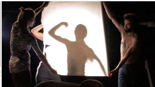
LA STORIA ©Woo