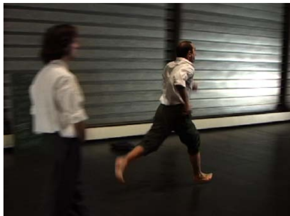
First issue

16 mai 2006 Festival Oltrepasso, Brindisi (Italie) 21 avril 2006 Festival Chemins de traverse, danses à Bron 6, 7 et 8 mai 2005 Napoli 11, Naples (Italie) 15 janvier 2005 Le Théâtre – Scène nationale de Mâcon.